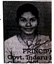
PRINCIPAL Govt. Indaru Distt. U. B. Kan